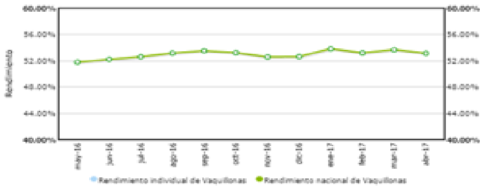
Comparación de rendimiento en DCP4

... que no contemplan tropas que tienen al menos un animal muerto en proceso. Tampoco son considera